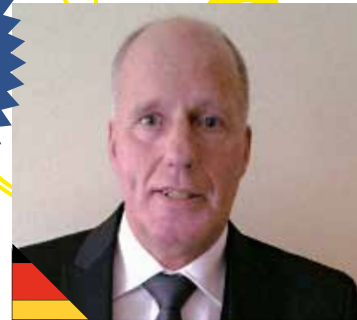
Heinz Ströhle, DE 47.326 PW

Εξαιρετική ποιότητα και συμβατότητα των προϊόντων.